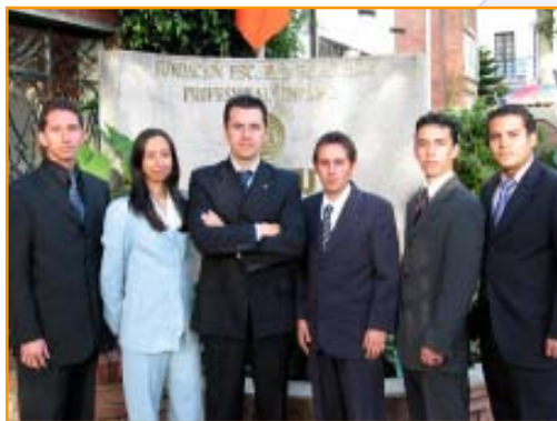
Grupo de prensa

Para este semestre la Oficina de Prensa está invitando nuevamente a todos los estudiantes que quieran hacer sus pasantías internas en la oficina, sitio en el cual se irán involucrando en el mundo del periodismo. ©